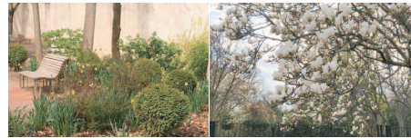
フランスに咲く花々

心躍る季節のはずが、パリでは3月20日から3度目の外出制限が導入されました。感染状況の悪化を耳にしつつも、個人的には外出制限に対する衝撃は初回に比べ、ぐっと軽減しており、良くも悪くも「慣れ」を感じています。コロナ禍の下、家族全員が多く時間を一緒に過ごすというある意味特異な生活も、すっかり馴染みになりました。とは言え、人生の一番鮮やかな時期に自粛生活を余儀なくされている若い人達のことを思うと心が痛みます。我が家の中高生の柔軟に順応していく様子は遅しくもありますが、母親としてはどこかせつなさを覚えます。