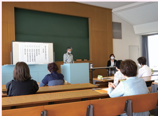
第9回定期代議員総会

開催にあたり、感染症感染拡大防止の観点から社会的距離の確保が可能な会場を母校よりご提供頂きました。終始和やかなうちに午後二時十分は無事閉会となりました。