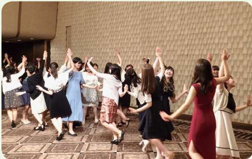
第62回同窓会でのカドリール (2019.5.26) ホテルグランドパレス